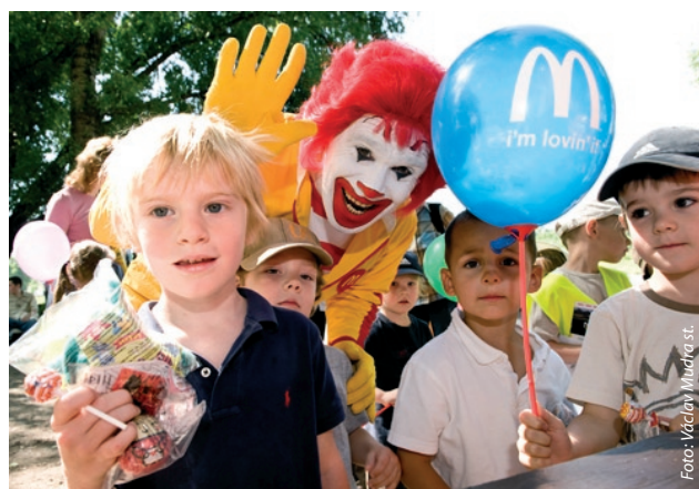
Partnerem olympijského dne je společnost McDonald's, a tak na akci nemohl chybět známý klaun Ronald McDonald.