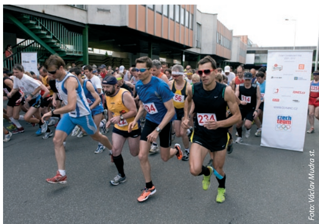
V Praze startovali běžci od stadionu Přátelství.

Olympijský den se poprvé slavil v roce 1948 a připomíná vlastně zrození moderních olympijských her 23. června 1894 v pařížské Sorbonně.