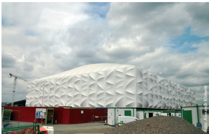
Mobilní basketbalová hala je již na svém místě.

Velkých sportovních momentů se diváci dočkají i na dalších místech Londýna. Využijí se Hyde Park, Wimbledon, Wembley či stadion Lords Cricket Ground (mimořádně – s věhlasným tiskovým střediskem navrženým českým architektem Janem Kaplickým). Na fotbal se bude jezdit po celých Ostrovech.