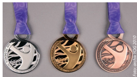
Medailová sada Olympijských her Mládeže.

Mladí sportovci z 205 zemí světa se sešli v Singapuru na Olympijských hrách mládeže (Youth Olympic Games – YOG). Z České republiky vyráží výprava čítající 60 členů, z toho 38 sportovců, kteří budou soutěžit v 16 sportech.