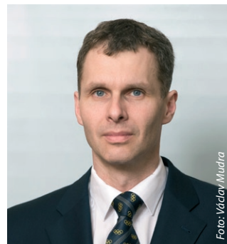
Místopředseda ČOV Jiří Kejval.

Český olympijský výbor (ČOV) chystá u příležitosti Her XXX. olympiády unikátní projekt s pracovním názvem „Česká olympijská sezóna“. V Londýně se veřejnosti otevře pavilón,