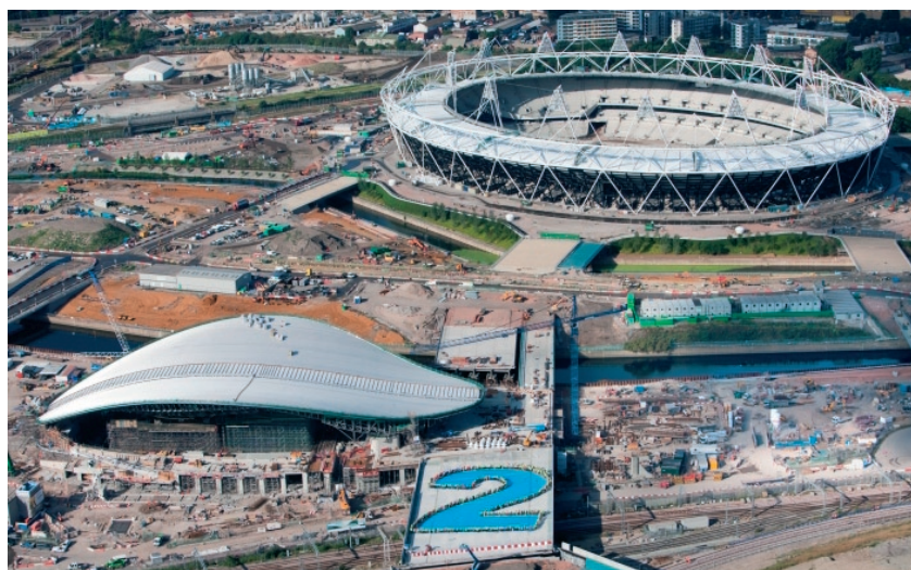
Olympijský park (nahore Olympijský stadion, dole plavecký stadion).

Necelé dva roky před zahájením Her XXX. olympiády nechali londýnští hostitelé nahlédnout novináře z celého světa pod pokličku příprav.